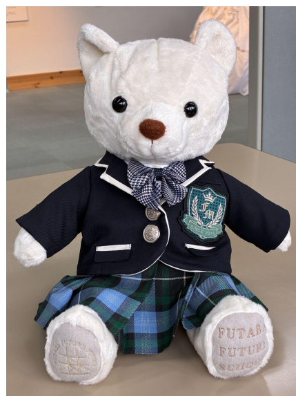
展示しているぬい服の一例 クマの足には校章と提供者名の刺繍が入る