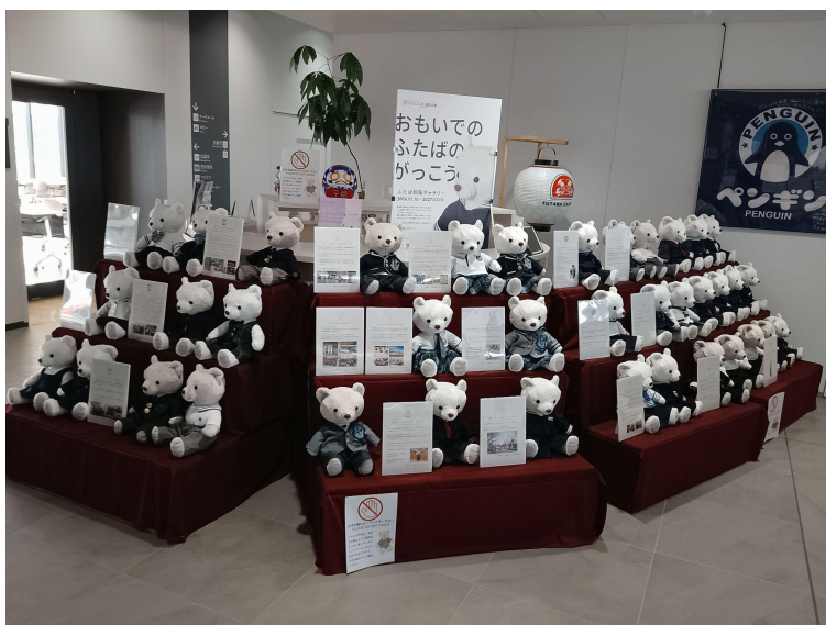
産業交流センターでの展示の様子

フレックスジャパン株式会社が運営する「ひなた工房 福島双葉」は、福島県双葉郡の中学校・高校へ通っていた皆さまからご提供いただいた制服を、ぬいぐるみサイズのぬい服に仕立てた展示「おもいでのおふたばのがっこう ふたば制服ギャラリー」を、2026年4月1日（土）より福島県双葉町にある東日本大震災・原子力災害伝承館にて開催します。一着一着に詰まった思い出を、手のひらサイズの展示として未来へつなぐギャラリーです。1月から開始した巡回展での、3箇所目の開催となります。