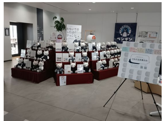
双葉町産業交流センターでの展示 (～3/26)