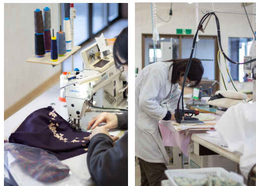
アトリエ内の様子