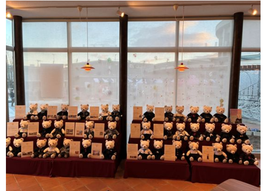
双葉町 ダルマ市での展示 (1/10・11)

本企画が、思い出とともに未来を歩むための小さな支えとなることを願い、開催しています。