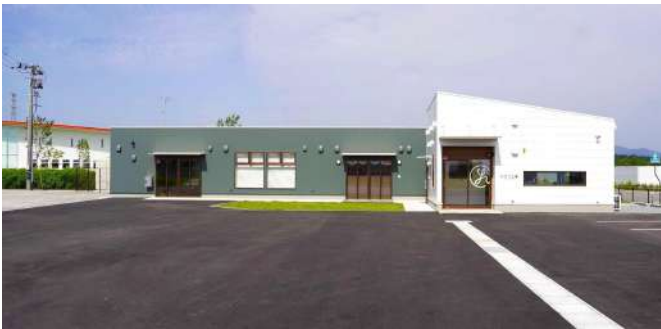
ひなた工房 双葉外観（向かって左からアトリエ、ショップ）