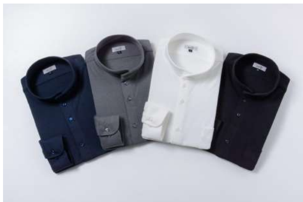
カラーバリエーション（スモース素材） 白、黒、ネイビー、ダークグレー