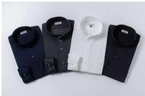
カラーバリエーション（天竺素材） 白、黒、チャコール、ネイビー