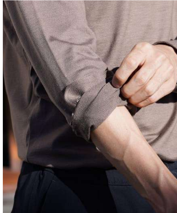
ドレスシャツらしい腕まくりも。