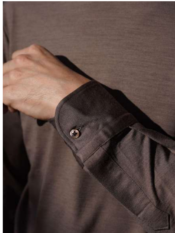
コンバーチブルカフにより、カフリンクスも楽しめる。