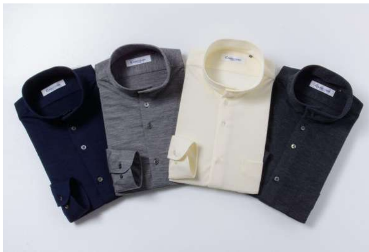
カラーバリエーション：クリーム、ネイビー、グレー、チャコールグレー