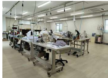
ひなた工房 双葉 アトリエの様子

当社は本年7月、福島県双葉町に縫製アトリエとショップを備えた「ひなた工房 双葉」を開業しました。「大人タートル」と「ラップネックカラー」は、「ひなた工房 双葉」のアトリエによる開発商品の第一弾です。