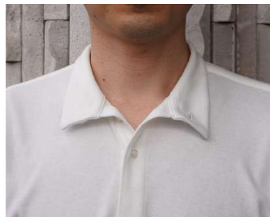
開襟衿での着用イメージ